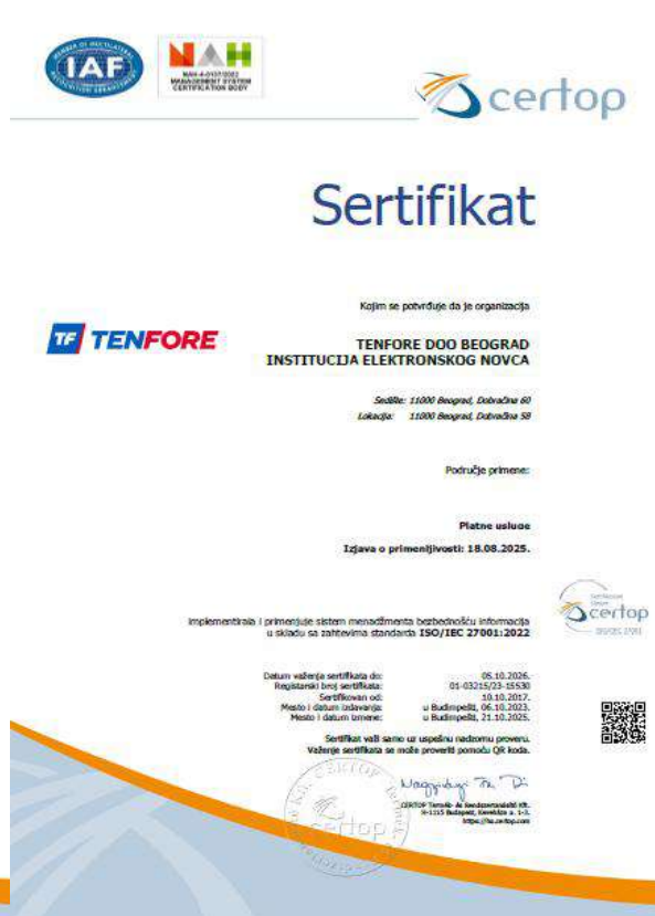
SERTIFIKAT ZA STANDARD ISO/IEC 27001:2022