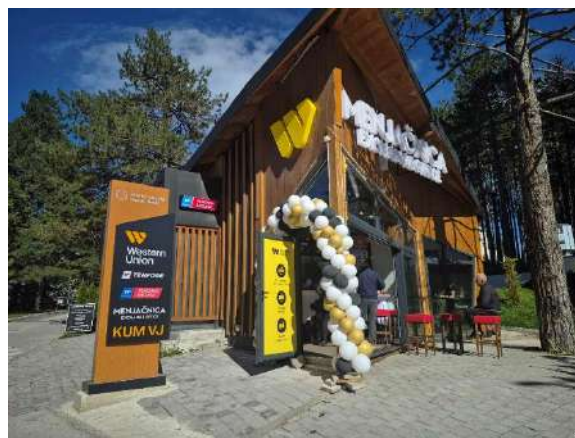
JEDNA OD TENFORE LOKACIJA

Ove usluge dostupne su na približno 650 lokacija širom Srbije, čime je obezbeđena široka geografska pokrivenost i dostupnost usluga različitim kategorijama korisnika, uključujući i stanovništvo u manjim sredinama, čime institucija doprinosi finansijskoj inkluziji.