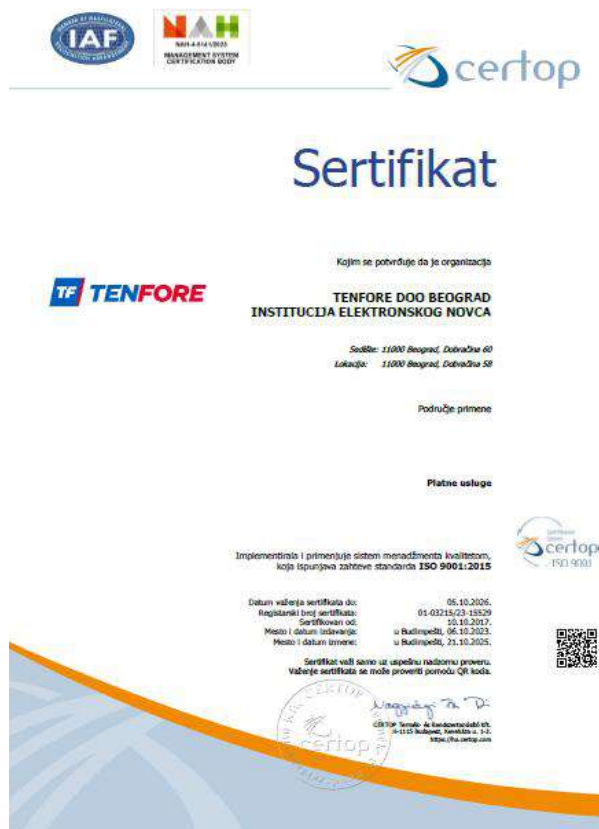
SERTIFIKAT ZA STANDARD ISO 9001:2015

Primena ovih standarda potvrđuje posvećenost TENFORE visokim standardima poslovanja, zaštiti informacija i podataka, kao i stalnom unapređenju zadovoljstva korisnika.