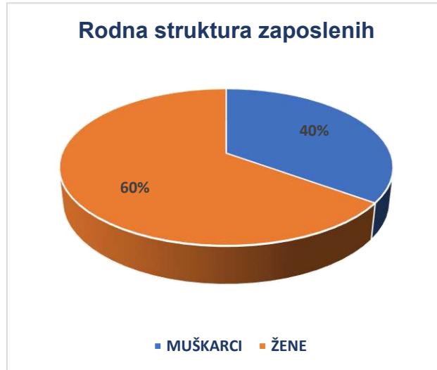
Rodna struktura zaposlenih

Brinemo kako o svojim zaposlenima tako i o njihovim porodicama i vodimo računa o njihovim profesionalnim, zdravstvenim i socijalnim potrebama, ne samo u obimu propisanom zakonom, već i više od toga, a posebno kroz: